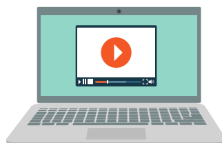
Clases grabadas en el aula virtual

Es indispensable contar con una buena conexión de internet.