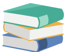
Material de estudio digital

Comprometidos con la transformación hacia la educación digital, presentamos CANVAS: una amigable plataforma que le permite al estudiante tener mayor facilidad para encontrar su material de estudio y participar de las actividades programadas durante el ciclo, tales como: foros, tareas, evaluaciones, etc.