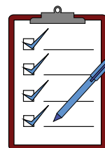
Exámenes y trabajos